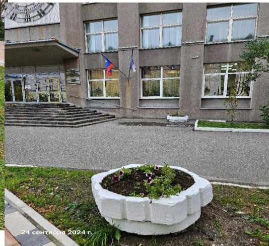
цветник возле памятника Героям северморцам (бархатцы, петуния)